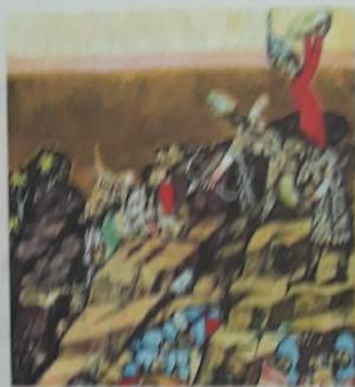
Bătălia de la Posada