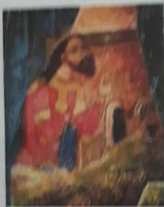
Voievodul Basarab I